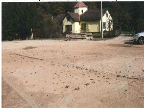
Pozemok KN C parc.č.2924/10, k.ú. Rožňava s parkoviskom, fotodokumentácia zo dňa 14.10.2017 a 12.01.2018