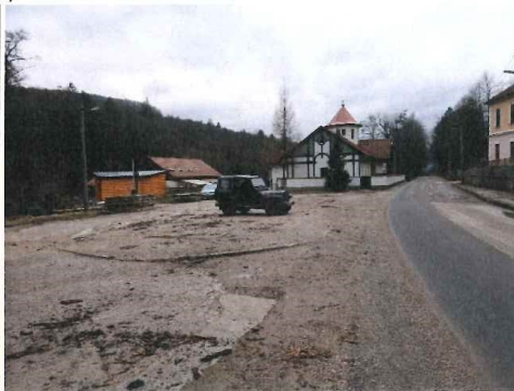
Pozemok KN C parc.č.2913/4, k.ú. Rožňava, fotodokumentácia zo dňa 14.10.2017 a 12.01.2018