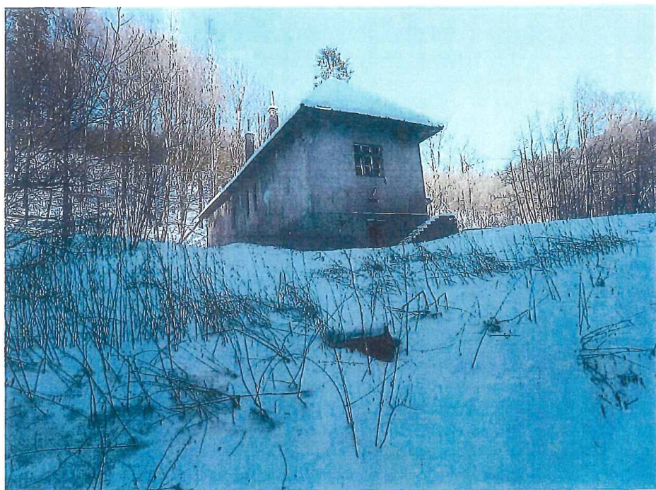
Obv. 2 Pohľad na objekt z ľavej cesty