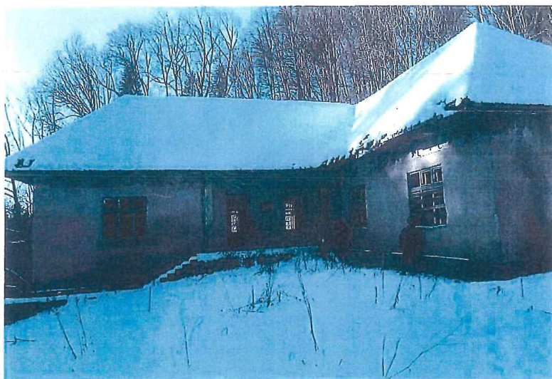
Obv. 1 Celkový pohled na objekt