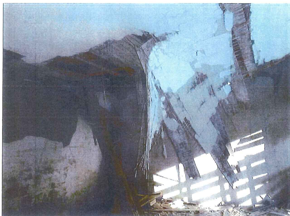
Obr. 5 Detailný pohľad na poškodenie stropu v podzemnej miestnosti