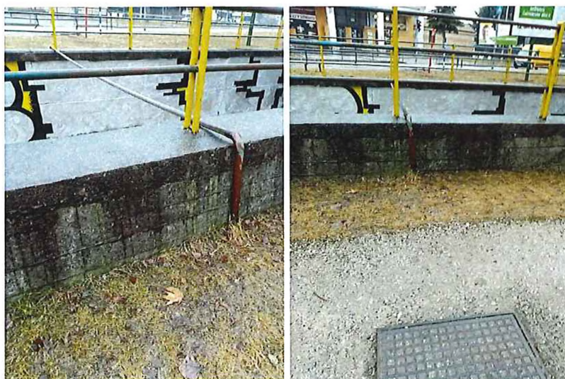
pri špeciálnej škole – náter ?