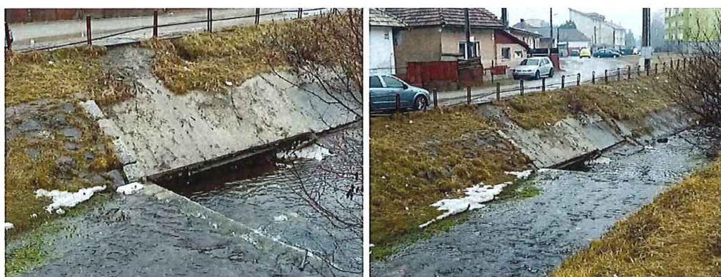
podmyté betónové časti