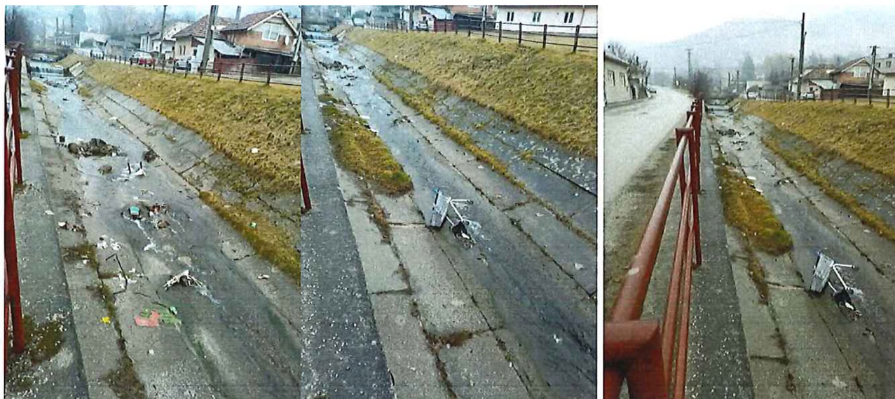
koryto znečistené odpadom