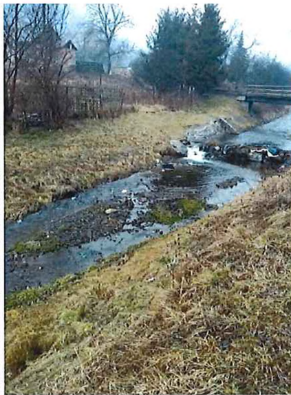
koryto naplnené nánosmi