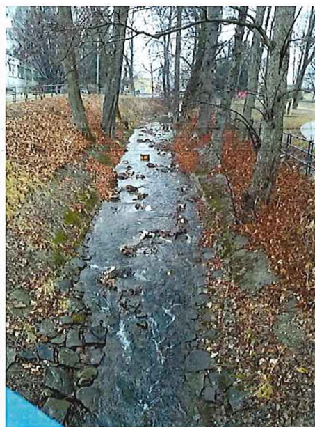
Póschová záhrada – uvoľnené brehové kocky