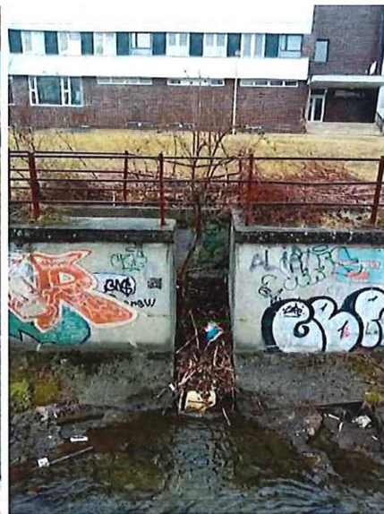
Koryto naplnené nánosmi drevín – nutnosť vyčistiť