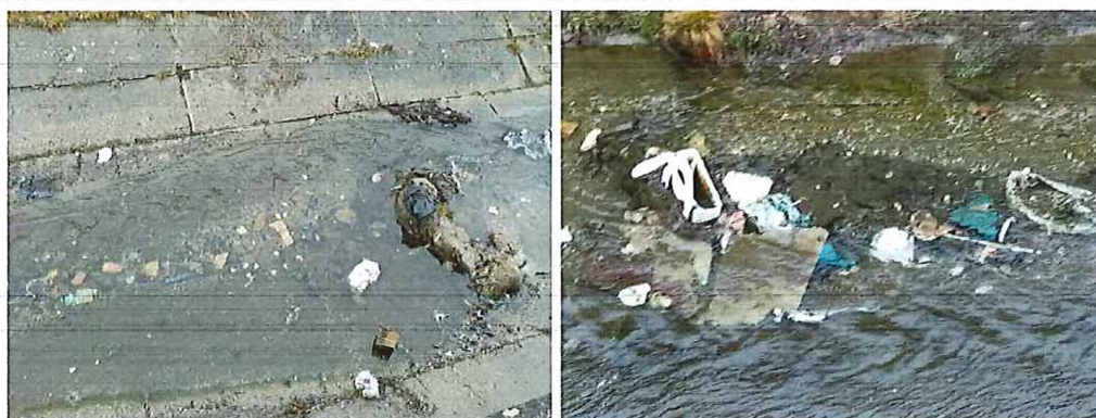
koryto znečistené odpadom