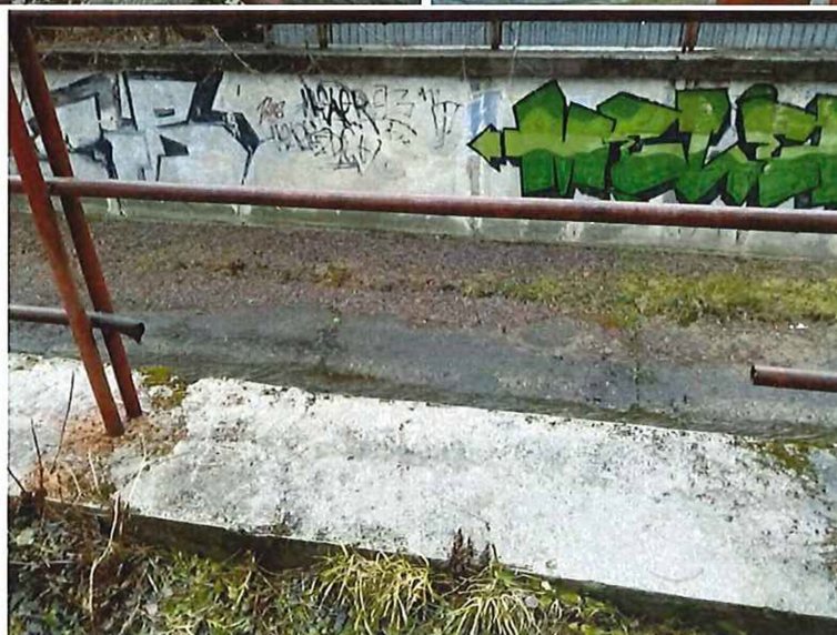
za ZŠ Komenského – maďarská - zábradlie