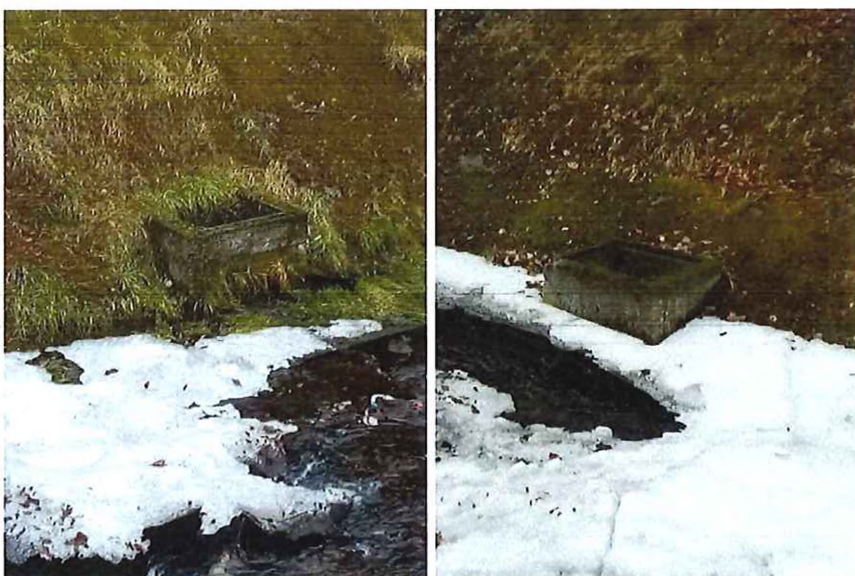
Otvorené šachty – kanalizačné poklopy osadiť