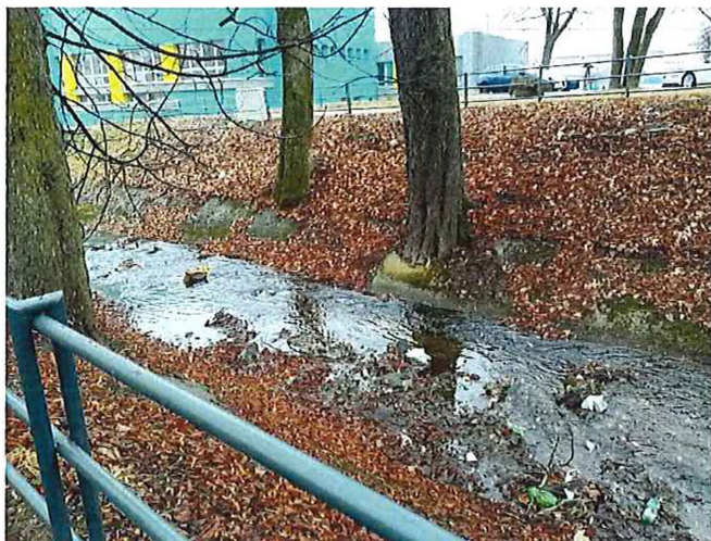
Póschová záhrada – koryto znečistené odpadom