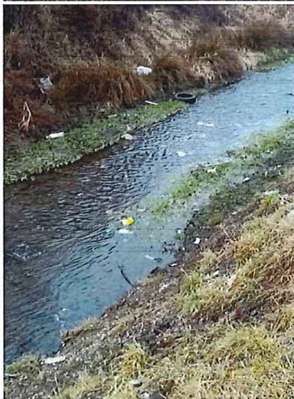
koryto znečistené odpadom