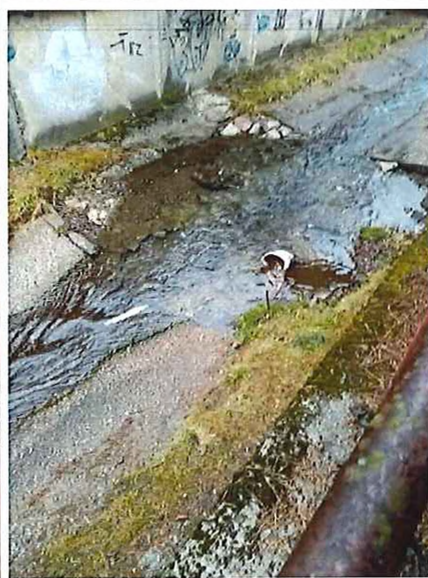
podmyté betónové časti