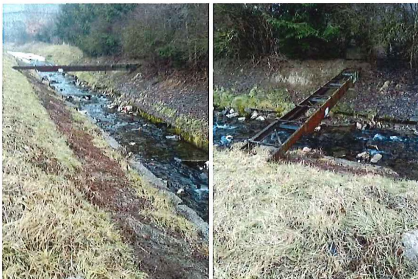
Nefunkčná lávka – odstránenie ?