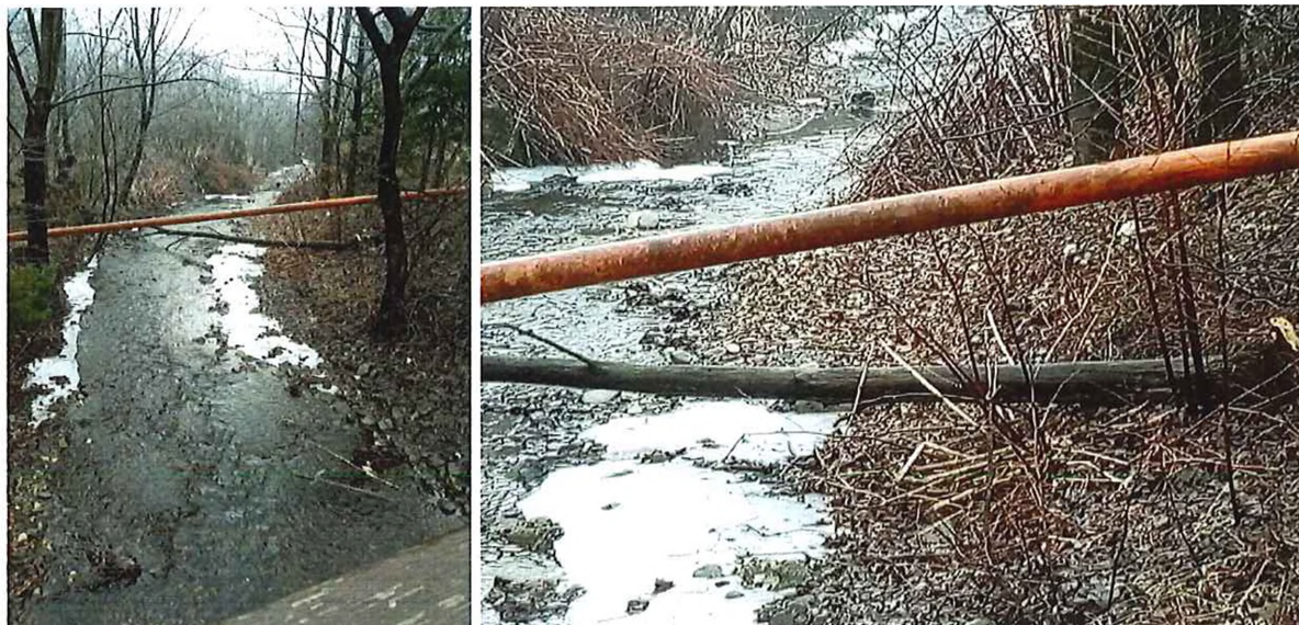
spadnutý strom v koryte – pri moste smer Gulyapalag