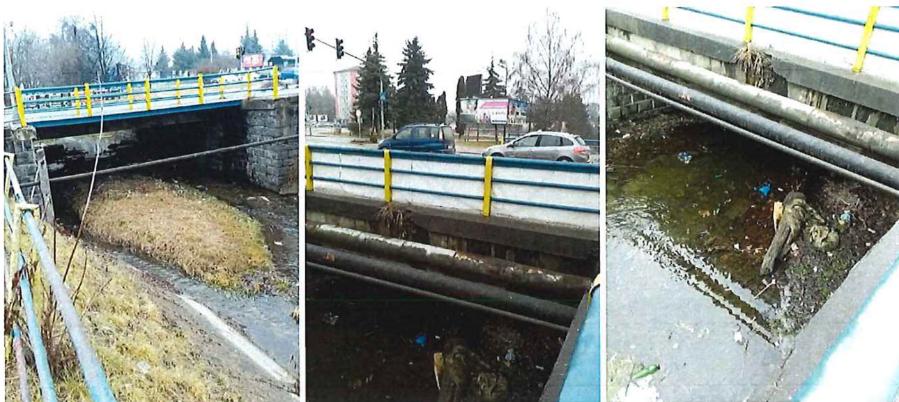
Koryto znečistené nánosmi – nutnosť vyčistiť