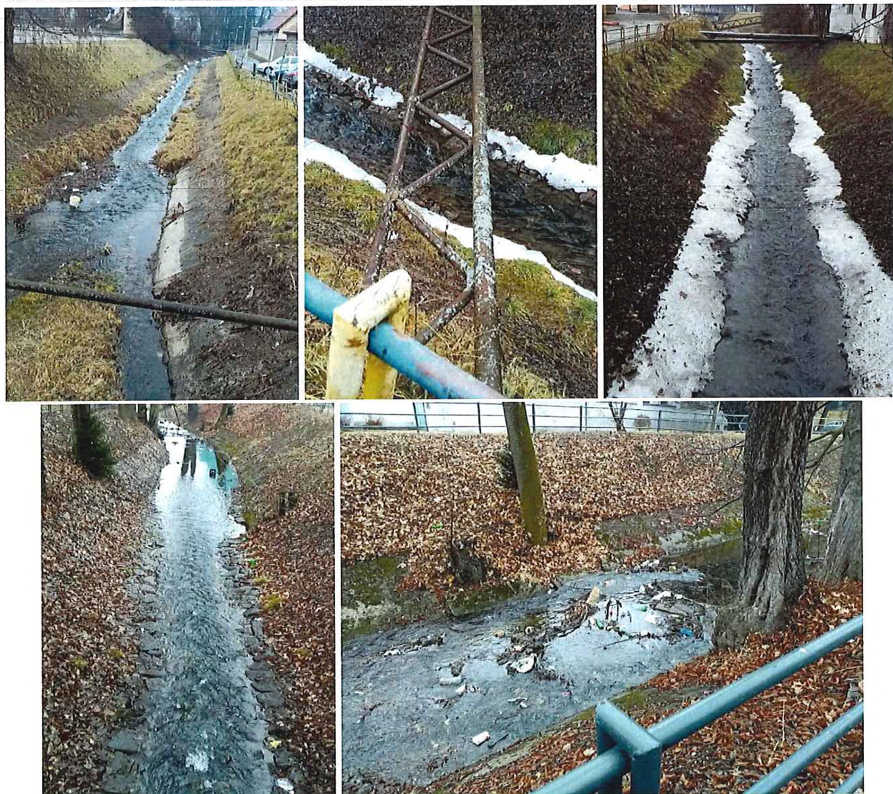
Póschová záhrada – koryto znečistené odpadom