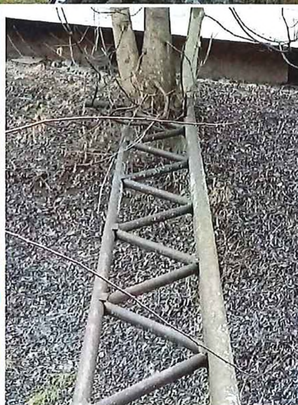
za Slobodárkou – korózia, náter ?