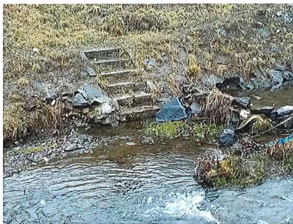
prepadnuté brehové kocky