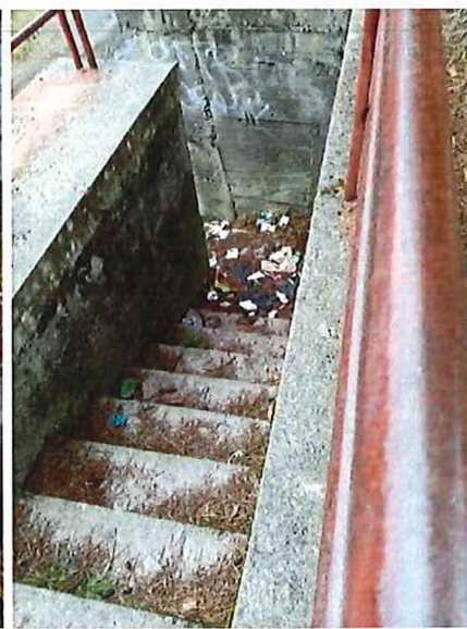
koryto naplnené nánosmi drevín