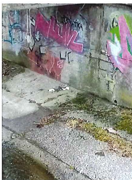
pri TESCO + Leporelo – upevnenie chráničiek