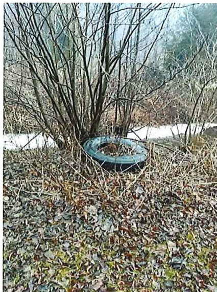
Čučma – Vilka kúpele