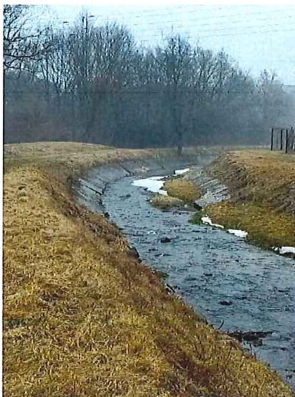
koryto naplnené nánosmi – nutnosť vyčistenia

( ústie rieky Slaná – Vargové pole – ul.Šafáriková )