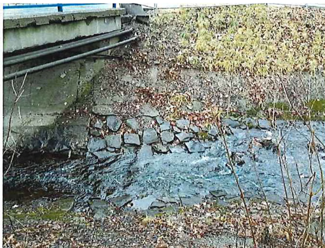
Póschová záhrada – uvoľnené brehové kocky