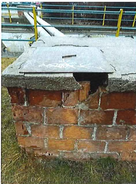
pri Daňovom úrade – údržba STEFE ?