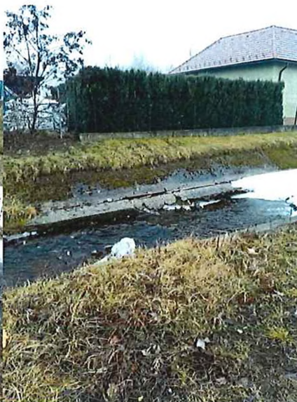
podmyté betónové časti