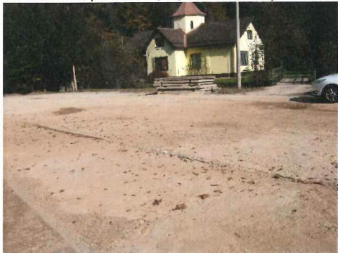
Pozemok KN C parc.č.2924/10, k.ú. Rožňava s parkoviskom, fotodokumentácia zo dňa 14.10.2017 a 12.01.2018