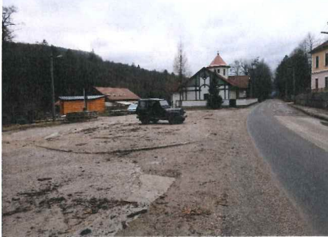
Pozemok KN C parc.č.2913/4, k.ú. Rožňava, fotodokumentácia zo dňa 14.10.2017 a 12.01.2018