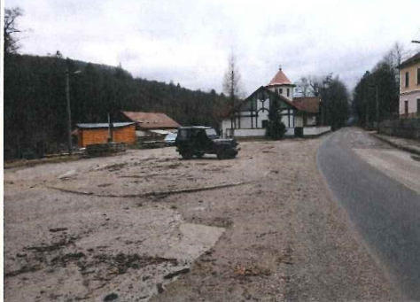
Pozemok KN C parc.č.2913/4, k.ú. Rožňava, fotodokumentácia zo dňa 14.10.2017 a 12.01.2018