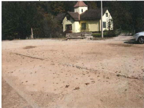
Pozemok KN C parc.č.2924/10, k.ú. Rožňava s parkoviskom, fotodokumentácia zo dňa 14.10.2017 a 12.01.2018