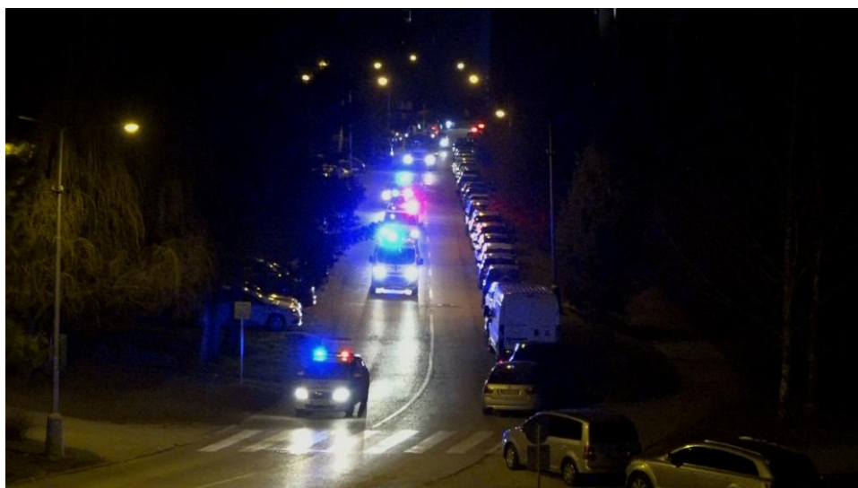
Vozidlá záchranej a bezpečnostnej zložky so zapnutými sirénami

Mesto Rožňava dňa 31. 3. 2020 o 20.00 hod. za spolupráce všetkých občanov Rožňavy uskutočnilo najkrajšiu a najväčšiu ĎAKOVAČKU pre všetkých tých, ktorí v týchto ťažkých časoch chodili do práce a riskovali svoje životy pre všetkých obyvateľov mesta a jeho okolia. Program začal o 19.56 hod., keď moderátor vyzval Rožňavčanov zhasnúť všetky svetlá v bytoch, následne o 19.58 hod. vyšli na balkóny a okná s mobilmi, zapaľovačmi alebo sviečkami. Po spustení hudby obyvatelia mesta zapli mobily a rôzne svetielka a mesto sa rozžiarilo. Po ukončení hudby nasledoval obrovský potlesk pre hrdinov v prvej línii a nasledovalo prekvapenie. Tlieskajúcim Rožňavčanom sa prišli na vozidlách s majákmi poďakovať všetky záchranné zložky aj policajti. Tí brázdili ulice mesta a prešli po každom sídlisku.