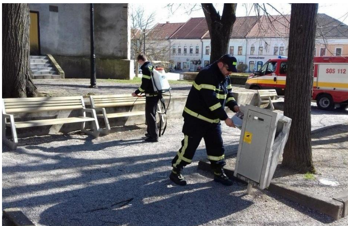
Dobrovoľní hasiči dezinfikujú park na Námestí baníkov

s dezinfekčnými prostriedkami a ochrannými pomôckami nakoľko bola očakávaná ďalšia potreba tejto činnosti. Napriek nie dobrej situácii pokračovali aj práce na rekonštrukcii hasičskej zbrojnice v Rožňave. S príchodom jesenných mesiacov sa začala príprava celoplošného testovania na COVID-19. Členovia boli poverení vykonávaním dezinfekcie všetkých odberných miest na území mesta počas prestávok v testovaní a odvážaní nebezpečného materiálu. Taktiež dezinfikovali ulice, autobusové zastávky, lavičky a priestory parkov. Na dezinfekciu použili antibakteriálny prípravok Dezintol. Celkovo pre mesto túto nápomocnú činnosť vykonávali 8 členovia DHZ Rožňava s 2 kusmi techniky. Počas celého roka členovia DHZ Rožňava v celkovom počte 15 odpracovali niekoľko stoviek hodín pre obyvateľov mesta a pre zvýšenie ich bezpečnosti v meste.