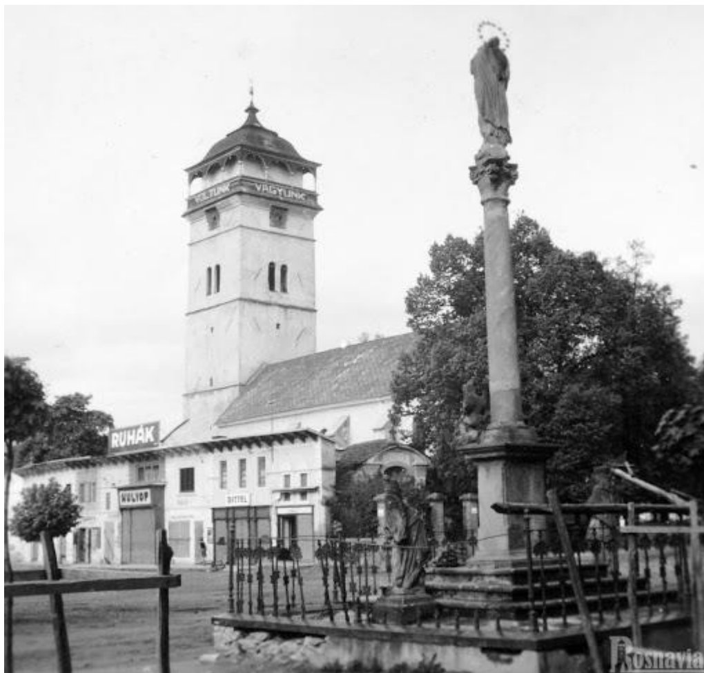
Morový stĺp v minulosti

Szilárdfy Zoltán: A magyarországi kegyképek és szobrok tipológiája és jelentése. Bp. 1994. 24–25.