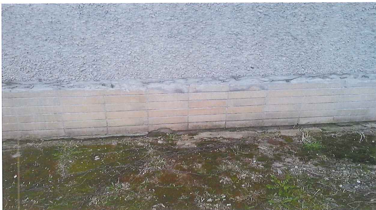
Pohľad na okapový chodník a sokel budovy