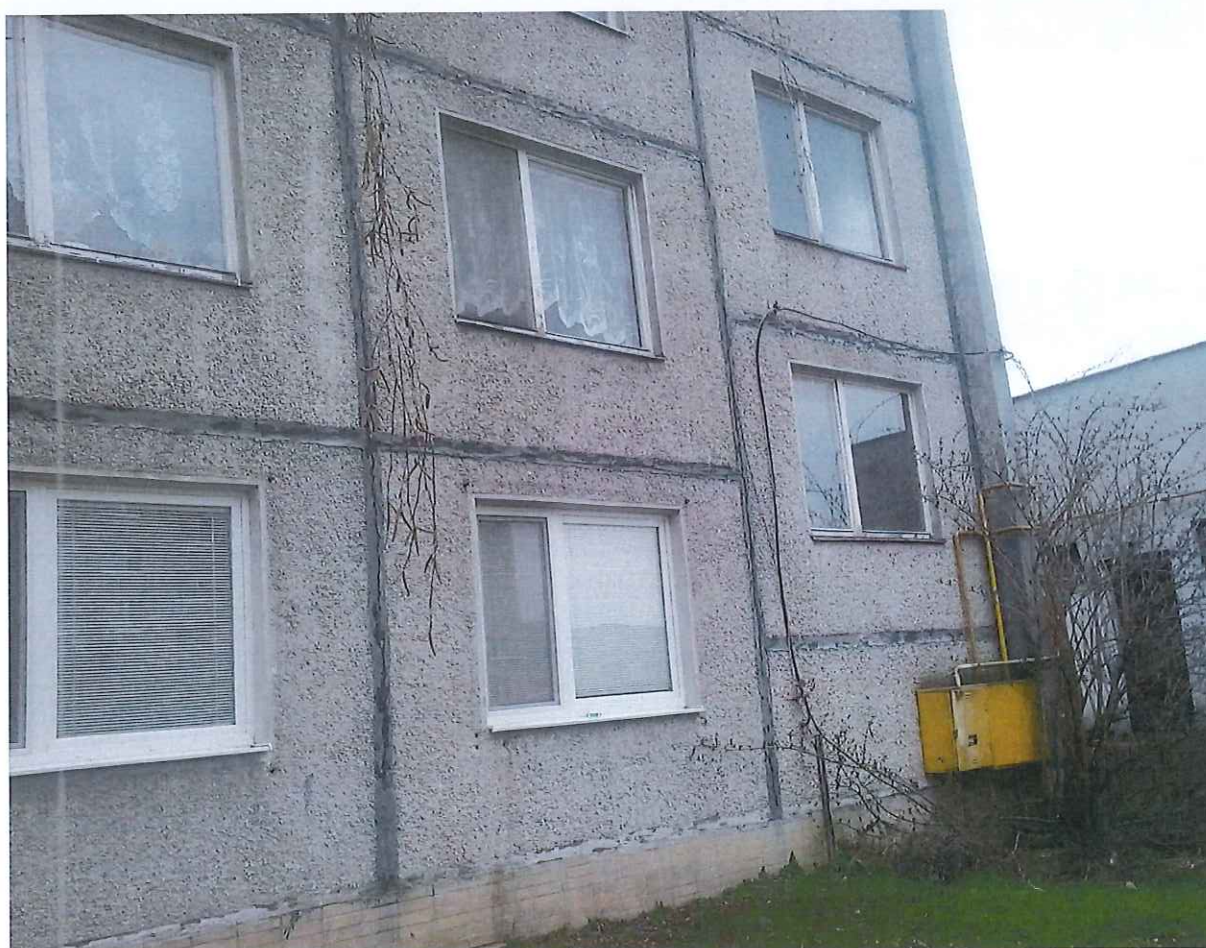
Pohľad na konštrukčné otvory budovy