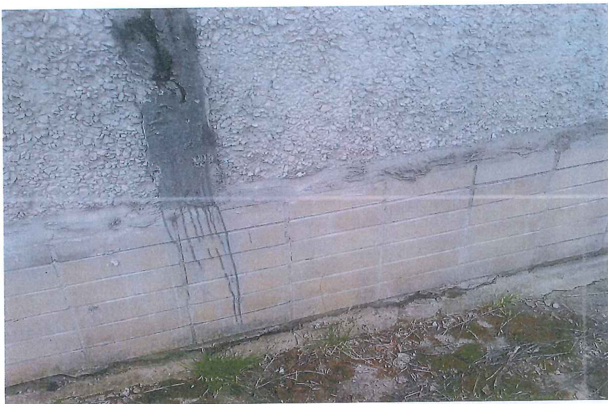
Pohľad na okapový chodník a sokel budovy