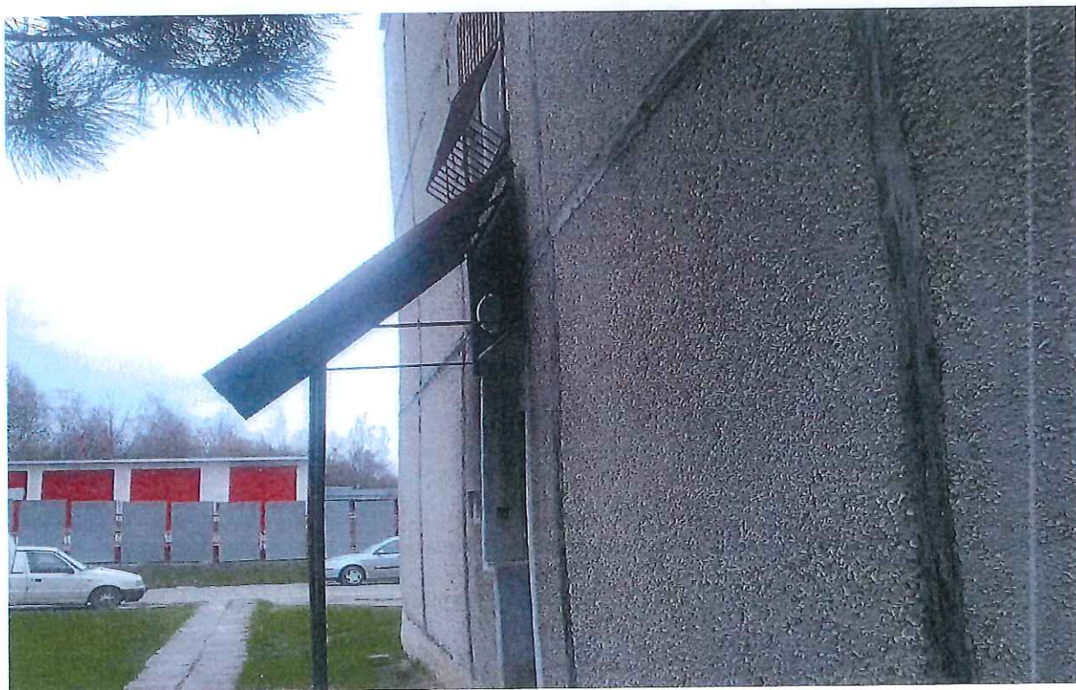
Bočný pohľad vstupu do budovy