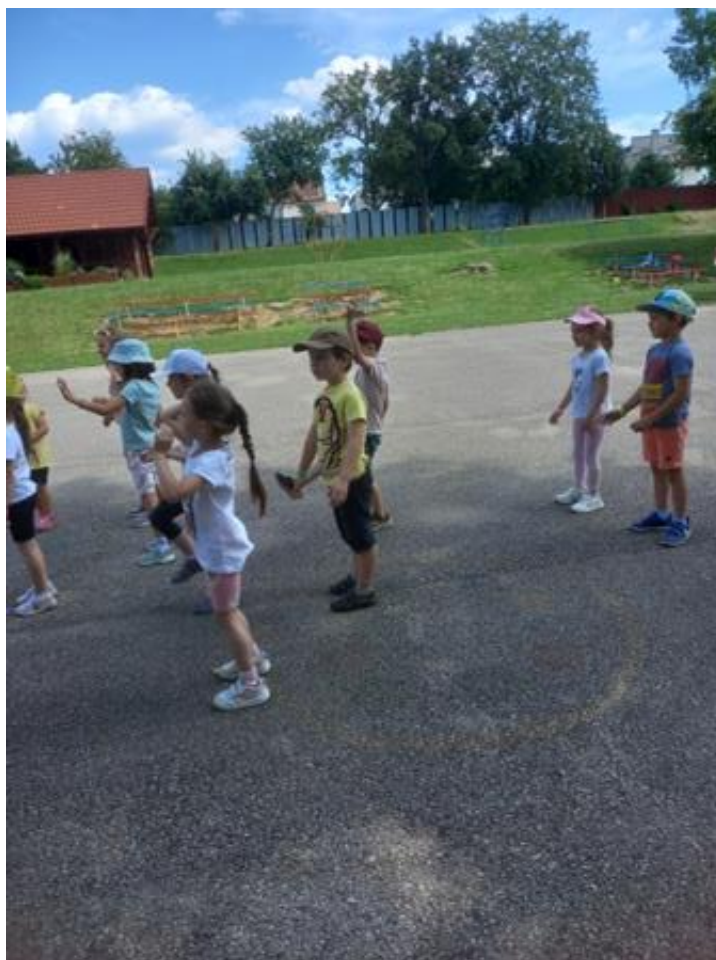
Základná škola, Zlatá 2, Rožňava