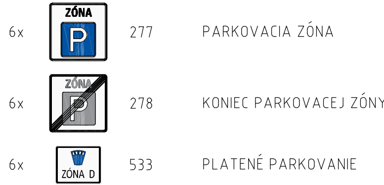
POČTY ZVISLÝCH DOPRAVNÝCH ZNAČIEK

POZNÁMKA: POČET SÚKROMNÝCH GARÁŽÍ NA SÍDLISKO " JUH" = 258ks