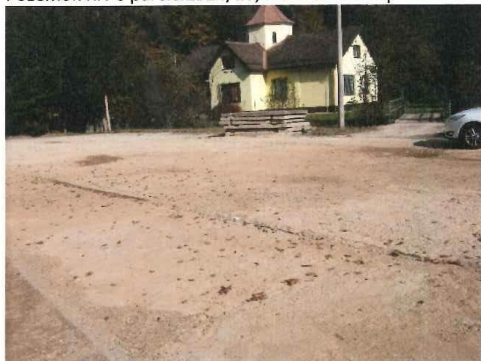
Pozemok KN C parc.č.2924/10, k.ú. Rožňava s parkoviskom, fotodokumentácia zo dňa 14.10.2017 a 12.01.2018