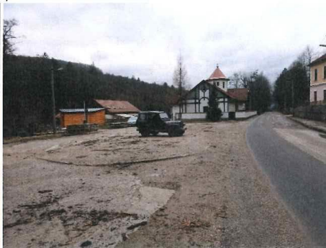
Pozemok KN C parc.č.2913/4, k.ú. Rožňava, fotodokumentácia zo dňa 14.10.2017 a 12.01.2018