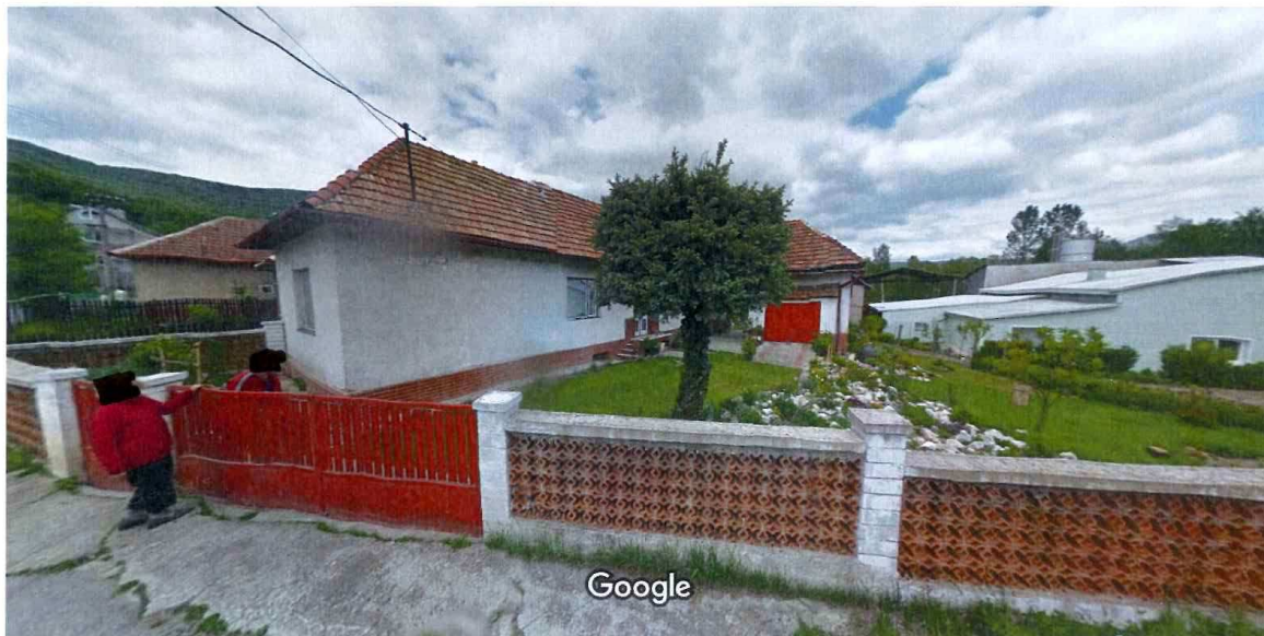
Vytvorenie snímky: máj 2012