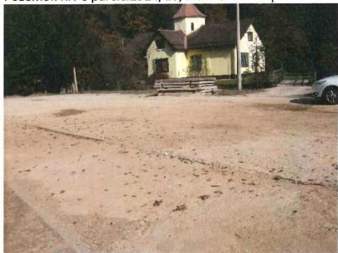
Pozemok KN C parc.č.2924/10, k.ú. Rožňava s parkoviskom, fotodokumentácia zo dňa 14.10.2017 a 12.01.2018