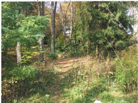
Pozemok KN C parc.č.2913/4, k.ú. Rožňava, fotodokumentácia zo dňa 14.10.2017 a 12.01.2018