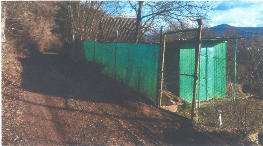
Príloha: 2. Fotodokumentácia ohradenej časti pozemku